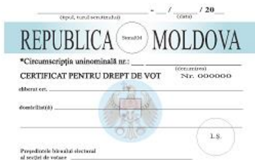
Imagine nr. 1: Modelul certificatului pentru drept de vot preluat din anexa nr. 14 a Regulamentului privind întocmirea, administrarea, difuzarea și actualizarea listelor electorale 4

Certificatul pentru drept de vot este un document care permite alegătorului să voteze în altă secție de votare decât cea la care este arondat. Dacă alegătorul în ziua alegerilor se va afla într-o localitate diferită de cea în care este înscris în lista electorală de bază, acesta își va putea exercita votul în cea de-a doua localitate, cu prezentarea certificatului pentru drept de vot.